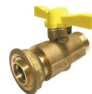
Robinet distributeur type D