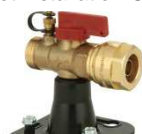
Robinet distributeur type E1A